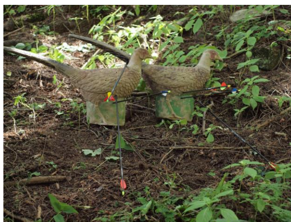
Nesprávne umiestnenie – terče sa prekrývajú